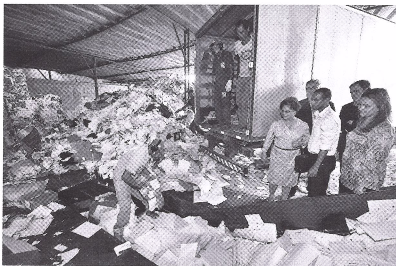
Os papéis serão triturados e destinados para indústrias de papel higiênico em todo o país

Cerca de 8 mil processos de execução fiscal, que já tiveram sua temporalidade expirada, foram eliminados pela Comissão Permanente de Avaliação Documental (CPAD) do Tribunal de Justiça da Bahia (TJBA), nesta quinta-feira (22).